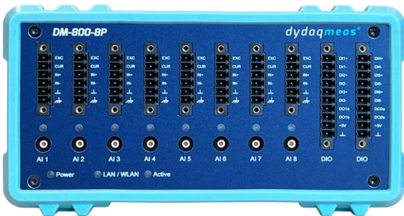
dydaqmeas mit 8 analogen Eingängen, digitalen I/O und leistungsfähigem ARM® Prozessor

Jedes dydaqmeas Messsystem ist gleichzeitig ein leistungsfähiger Edge Computer mit integriertem Web- server. Alle Funktionen sind über die moderne Weboberfläche in einem Browser einzurichten und zu verwalten. Über individuell gestaltete Dashboards können die Messdaten überall auf der Welt in einem Webbrowser angezeigt werden.